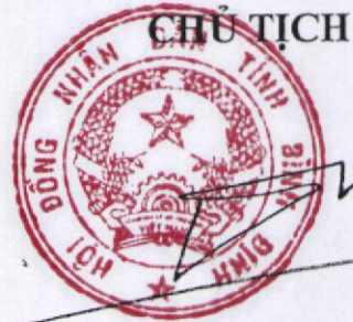
Hồ Quốc Dũng