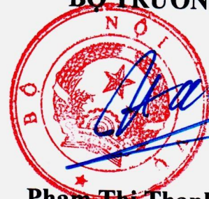
Phạm Thị Thanh Trà