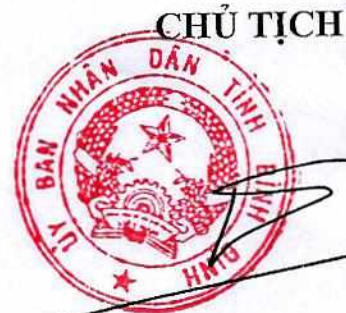
Hồ Quốc Dũng